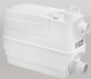
Objednací číslo: 97775317

Objem: 5,7 litrů Rozměry v mm (š x h x v): 373 x 158 x 255