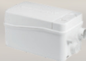
Objednací číslo: 97775318

Objem: 2,0 litry Rozměry v mm (š x h x v): 299 x 165 x 147*