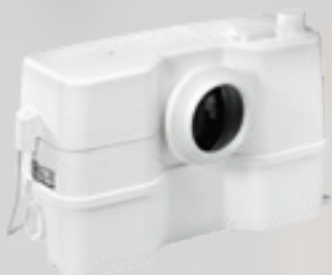
Objednací číslo: 97775315

Objem: 9,0 litrů Rozměry v mm (š x h x v): 453 x 176 x 263*