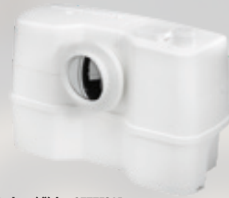
Objednací číslo: 97775314

Objem: 9,0 litrů Rozměry v mm (š x h x v): 453 x 176 x 263*