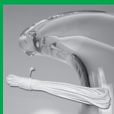
Vázací lanko 15m