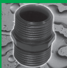
Vsuvka s o-kroužky